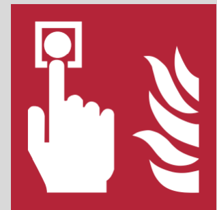
Sistemas de detección y alarma de incendios