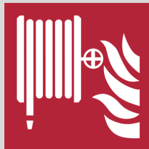
Bocas de incendio equipadas